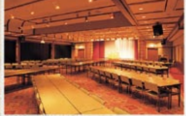
コンベンションホール ゆぎつばき 会議、ご宴会、ご婚礼、ご披露宴など、最大300名様にご利用いただける多目的ホールです。