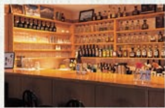
スナック ひとりしずか