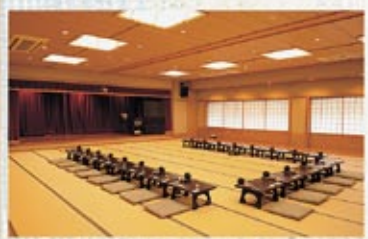
宴会場 いわかがみ 最大100名様までご利用できる大広間です。大小のご宴会のほか、会議・研修の場としてもご利用いただけます。