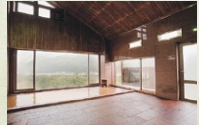
日帰り温泉入浴施設のご案内 深沢温泉