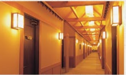
舟底造りの天井が特徴の客室廊下にあたたかな灯りがとまります。

エントランスからエレベーターで2階へ上がっていただければ、すべてがワンフロア。どなたにもやさしい、ゆったりとした、くつろぎの空間です。