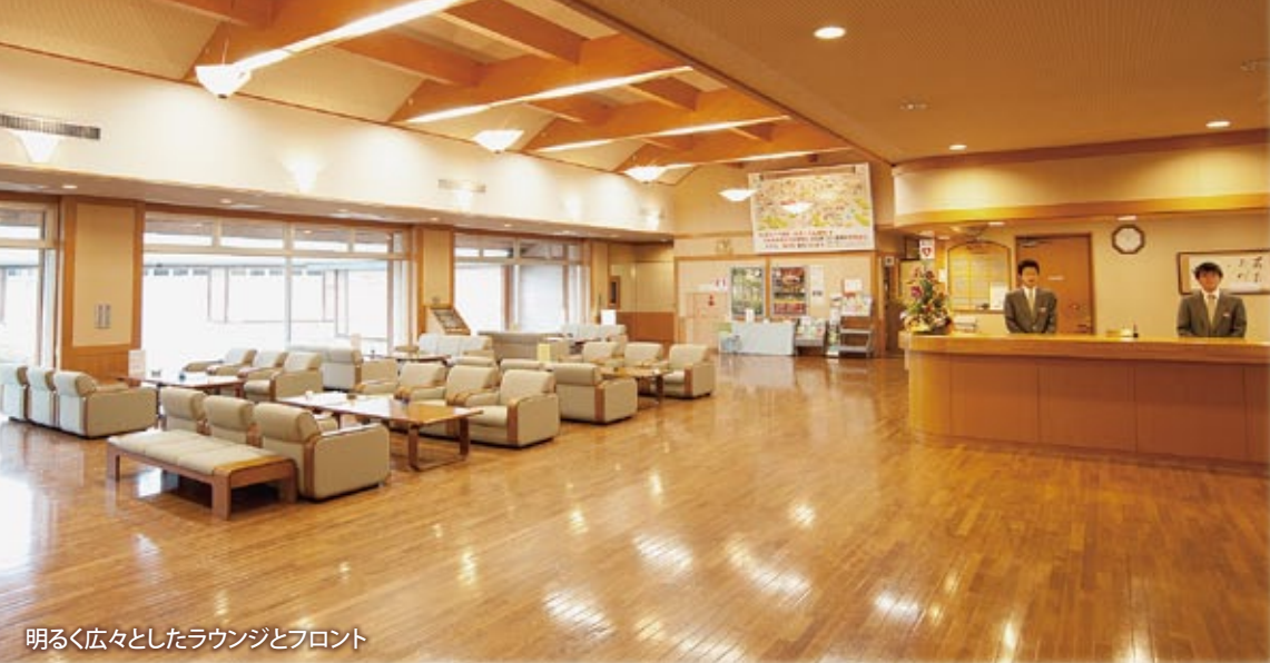
明るく広々としたラウンジとフロント